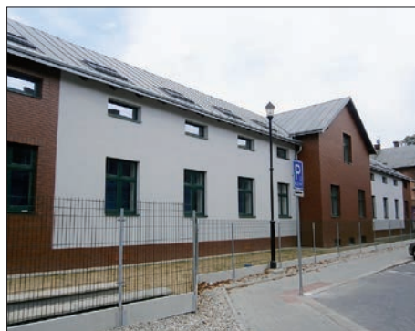
Nemocnice rekonstruuje své objekty.

Změn dozná také spektrum koncertních cyklů. Úplnou novinkou je pak nedělní Rodinný cyklus, v němž chce Janáčkova filharmonie upřít svou pozornost na nejmenší posluchače.