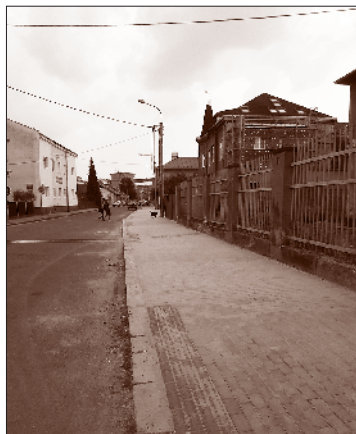
Chodník v Syllabově ulici.

Vedení obvodu i v letním období plnilo plány, které byly stanoveny v rozpočtu na rok 2013. „Byly opraveny chodníky v ulici Syllabově, což je dlouhý chodník kolem bývalé zábřežské nemocnice, dnes lékařské fakulty, v hodnotě 1,4 milionu korun. V hodnotě 1,3 milionu korun byly rekonstruovány chodníky v ulicích Mečnikovově a Pasteurově a uskutečňují se další akce. Probíhá výběrové řízení na úpravu ulice Přerušené,“ uvádí příklady starosta Petr Dlabal. „O prázdninách byla provedena rekonstrukce topení v Základní škole Šalounova v ceně zhruba 1,5 milionu korun, na kterou jsme museli zajistit finanční prostředky. V nově upravené budově školy v Halasově 30 byly o prázdninách odstraňovány reklamační vady a připravovány terénní venkovní úpravy. Mrzí nás, že zatímco jedni se snaží, druzí ničí, co jim přijde pod ruku. O srpnovém víkendu rozbili vandalové v rekonstruované budově školy velké okno, škoda je odhadována na 6 tisíc korun.“