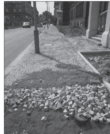
Chodník v Halasově ulici.

Vedení obvodu i v letním období plnilo plány, které byly stanoveny v rozpočtu na rok 2013. „Byly opraveny chodníky v ulici Syllabově, což je dlouhý chodník kolem bývalé zábřežské nemocnice, dnes lékařské fakulty, v hodnotě 1,4 milionu korun. V hodnotě 1,3 milionu korun byly rekonstruovány chodníky v ulicích Mečnikovově a Pasteurově a uskutečňují se další akce. Probíhá výběrové řízení na úpravu ulice Přerušené,“ uvádí příklady starosta Petr Dlabal. „O prázdninách byla provedena rekonstrukce topení v Základní škole Šalounova v ceně zhruba 1,5 milionu korun, na kterou jsme museli zajistit finanční prostředky. V nově upravené budově školy v Halasově 30 byly o prázdninách odstraňovány reklamační vady a připravovány terénní venkovní úpravy. Mrzí nás, že zatímco jedni se snaží, druzí ničí, co jim přijde pod ruku. O srpnovém víkendu rozbili vandalové v rekonstruované budově školy velké okno, škoda je odhadována na 6 tisíc korun.“