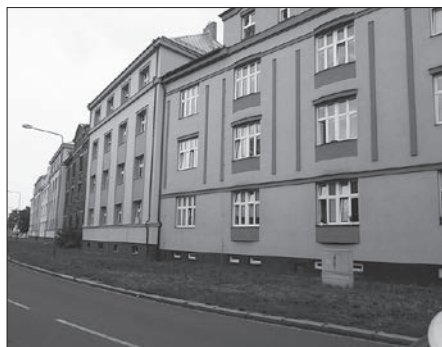
Vnější část bloku domů Štramberská 2 až 18.