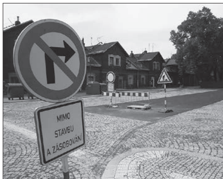
Parkoviště u prodejny Hruška.

Vážení čtenáři, po krátké prázdninové odmlce se k vám opět vrací náš zpravodaj s množstvím zajímavých informací. K těm