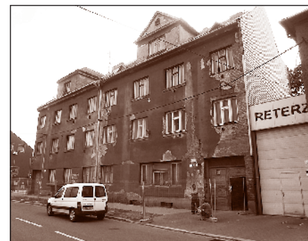
Domy Štramberská 29 a 29A.

V nejbližších dnech bude v rámci programu IPRM předáno staveniště bloku domů Štramberská 2 až 18, kde proběhnou venkovní úpravy vnější i vnitřní části. „Na vnější straně vzniknou parkovací místa, která jsou zde velmi potřebná,“ komentuje stavební akci starosta Petr Dlabal. „Uprostřed vnitřní části vznikne jednosměrná ulice včetně parkovacích míst tak, aby auta už nejezdila těsně pod okny, jako tomu bylo doposud. Bude to bezpečnější jak pro chodce, tak i pro parkující vozidla, na která občas z oken domů létaly předměty odhazované místními nájemníky.“